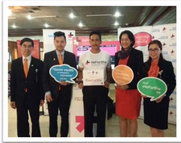
ถ่ายภาพร่วมกันที่ชุมนุมิทรศการ ของ UN Women