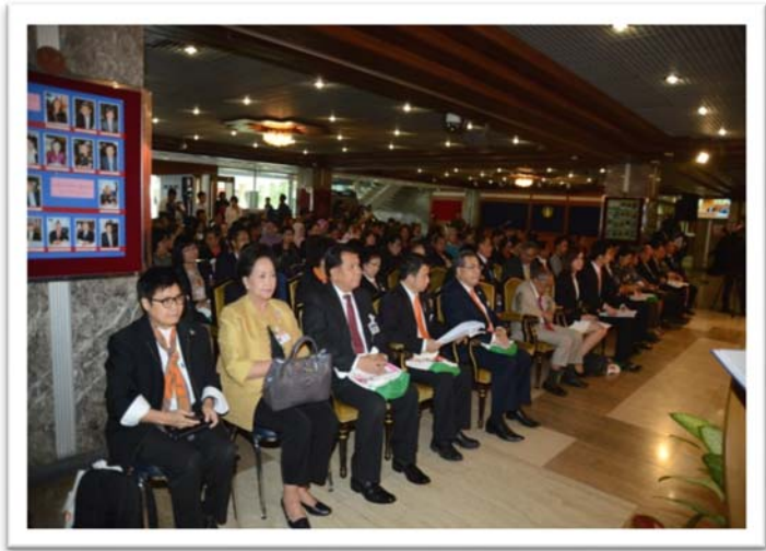
ผู้เข้าร่วมเสวนา